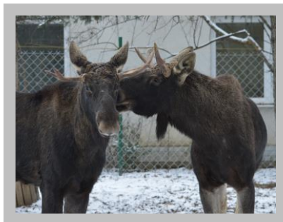
Losy na VÚŽV v Nitre