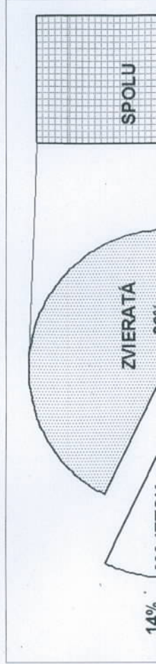
Štruktúra odpisov základného stáda dojčiacich kráv v roku 2013 (8 stád)