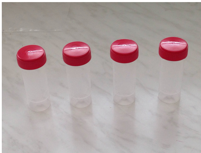
Obr 3: Vzorkovnice.

Zmesné vzorky po odbere odovzdajú chovatelia na regionálnej veterinárnej a potravinovej správe. Táto zabezpečí vypísanie sprievodného dokladu a odošle vzorky do národného referenčného laboratória v Dolnom Kubíne alebo veterinárnych a potravinových ústavov Bratislava a Košice.