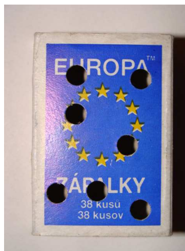
Obr. 2: Dierkovačom perforovaná krabička zabezpečuje, aby vzorka neporástla plesňami. Pred predierkovaním vrchnáka vyberte vysúvaciu časť, aby ostala neporušená.

Ak je vzorka príliš vlhká, je možné ju nechať v otvorenej škatuľke čiastočne presušiť pri izbovej teplote počas 12-24 hodín. Vzorky nesušte na radiatore !!!! Pri balení vzoriek pred odoslaním používajte len priedušné materiály (papier, papierové krabice). Nevkladajte vzorky do igelitových vreciek a obalov , nakoľko takto zabalené vzorky plesnivejú a skresľujú výsledky získané z Vašich vzoriek !!! Vzorky balené do nepriedušných igelitových obalov nebudú vyšetrené.